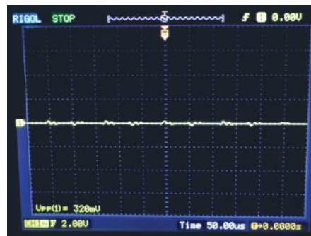
Protegido con BPK de Helwig